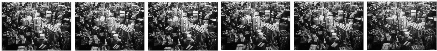
(가) 웰스(O. Welles), <시민 케인> 중 마지막 장면의 일부(1h:54m:59s~1h:59m:22s), 1941

4. 다음 작품과 설명을 참고로 <작성 방법>에 따라 서술하시오. [4점]