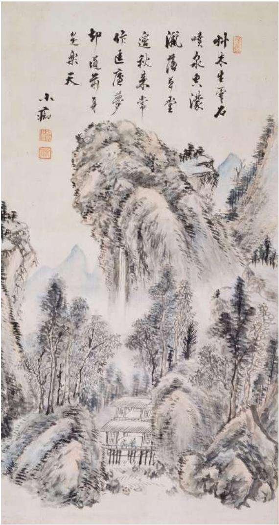
(나) 허련, <추경산수도>