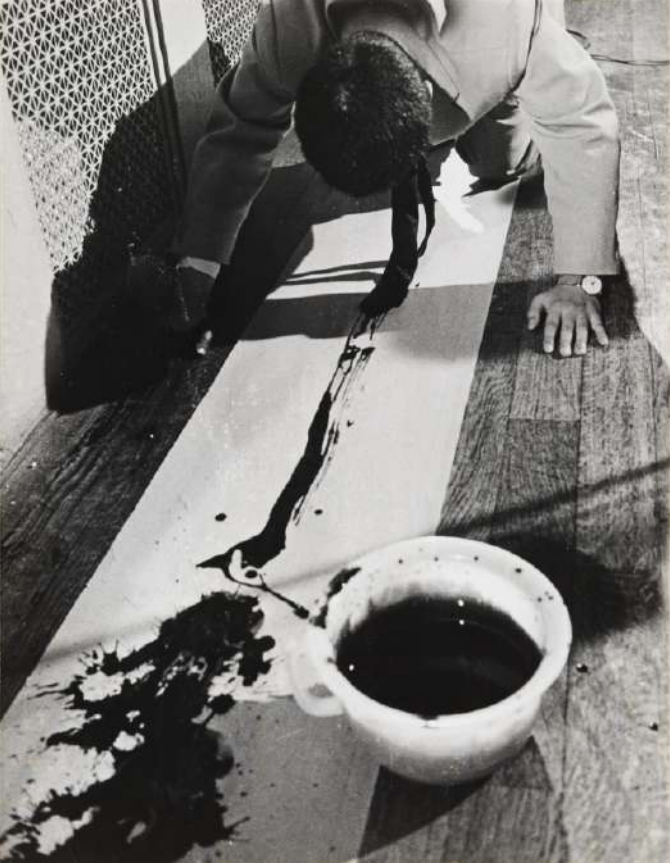
백남준, <머리를 위한 선(禪)>