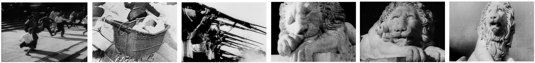
(나) 에이젠슈타인(S. Eisenstein), <전함 포템킨> 중 오데사 계단 장면의 일부, 1925

작가들이 영상 작품을 제작할 때 현장에서 최우선으로 생각해야 할 문제는 ‘무엇을 찍을 것인가’, ‘어떻게 찍을 것인가’, ‘그것을 어떻게 보여줄 것인가’이다. 이러한 질문은 ‘무대 장치’, ‘무대 위의 배치’를 의미하는 ( ㉠ )와/과, ‘샷’의 조립인 몽타주와 관련된다. (가)는 작가에 의해 극적으로 연출된 <시민 케인>의 마지막 장면이다. (나)는 <전함 포템킨> 중 오데사 계단 장면으로 ㉡ 몽타주에 대한 에이젠슈타인의 이론을 잘 보여준다. 이러한 기법들은 더 큰 감동과 효과를 의도하는 영상 작가들에 의해 다양하게 활용되고 있다.