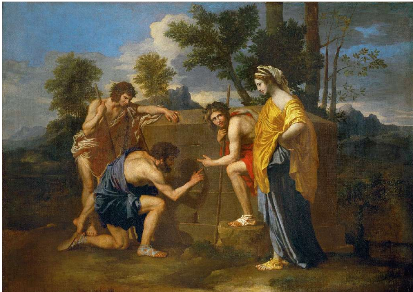
푸생, <아르카디아에도 나는 있다>

푸생(N. Poussin)은 프랑스 바로크 회화를 대표하는 화가 중 한 명이다. 그는 회화란 미의 이데아에 관여하는 것이라고 여겼으며, 규칙과 이성을 기반으로 조형 양식을 체계화하고자 했다. 푸생이 이탈리아를 주 무대로 활동했음에도 불구하고 동시대 프랑스 화단에 많은 영향을 미쳤던 이유는 1648년 파리에 설립된 왕립 회화 조각 아카데미가 그의 조형 이념을 표본으로 삼았기 때문이었다. 17세기 후반부터 18세기 까지 유럽 각국의 아카데미에서는 역사화 장르에서 ( ㉠ )이/가 특별히 강조되었는데, ㉡ 이 양식에서 특히 중요하게 여겨졌던 것은 ‘ 고상한 주제 ’였다. 1768년 설립된 영국 왕립 미술 아카데미 원장 레이놀즈(J. Reynolds)는 이 양식의 목적과 의의를 강연에서 상세하게 다루면서 푸생을 대표적인 작가로 제시하기도 했다. 이처럼 ㉢ 푸생의 조형 이념은 서양 근세 아카데미 미술 교육에서 중요한 토대가 되었다.