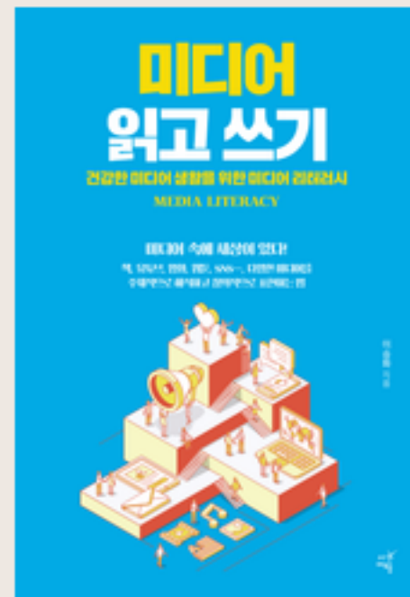
미디어 읽고 쓰기 2021