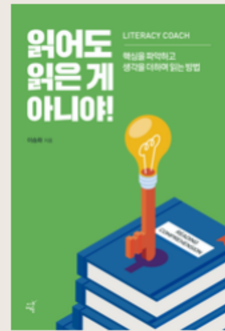
읽어도 읽은 게 아니야! 2023