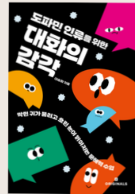
도파민 인류를 위한 대화의 감각 2025