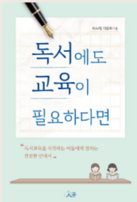
독서에도 교육이 필요하다면 2020

+ <책으로 나를 읽는 북렌즈>, <인생을 결정하는 유초등 교육>, <나를 중심으로 미디어 읽기>