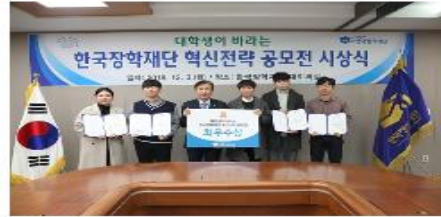
[보도자료] 한국장학재단 혁신 전략 공모전 시상식 개최