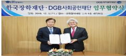
[보도자료] 한국장학재단, DGB사회공헌재단과 대구·경북 사회배려계층 대학생 생활...