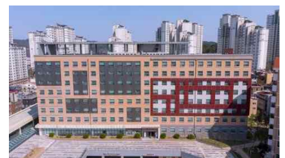
목원학사 V관 (남·여)